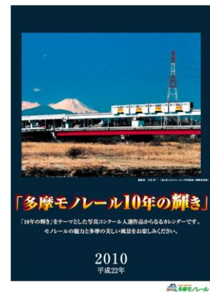
【平成 22 年カレンダー】