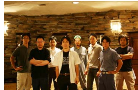
アサンブラージュメンバー

山梨で生まれ山梨で育ったワイン醸造家たちが、「より上質のワインを造りたい」という共通意識の元に集まる。メンバーは全員1970年代生まれ。山梨県内の中小ワイナリーの後継者8名で構成されており、先人の培ってきた知識、伝統、経験を継承しつつ、意欲あるワイン造りを行っている。