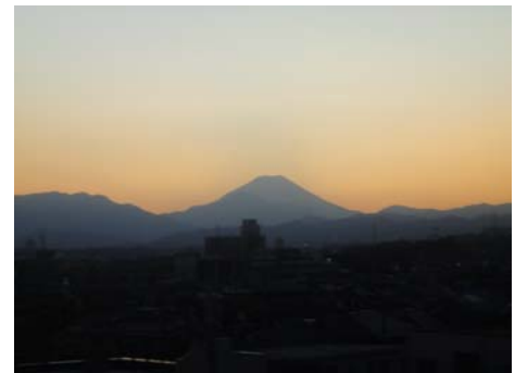
ワイン列車からの景色