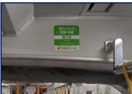
抗ウイルス・抗菌コーティング施工済ステッカー