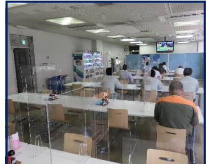
アクリル板の設置状況（食堂）