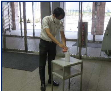
入館時の手指消毒