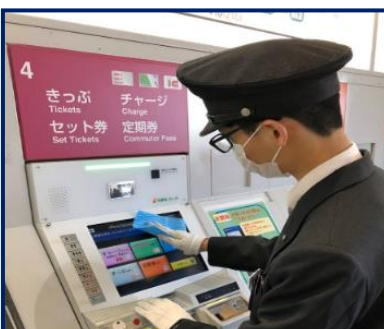
券売機の消毒状況