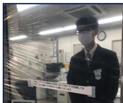
ビニールシートの設置