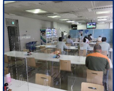
アクリル板の設置状況（食堂）