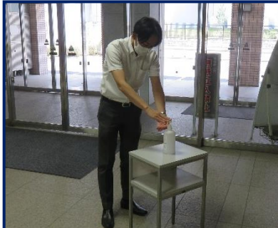
入館時の手指消毒