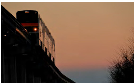
土屋 勝範 様 「Sunset Orange」