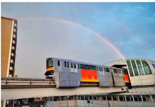
内野 欽章 様 「夕暮れのレインボーアーチ」