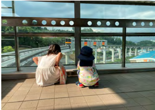
稲垣 博昭 様 「モノレールが来たよ」