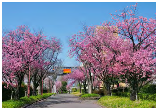
染谷 博 様 「ピンクのロード」