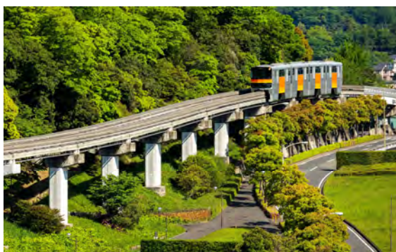
勢津 文忠 様 「新緑の淡い春紅葉を走るモノレール」