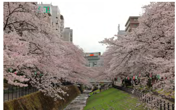
菅原 瑠衣斗 様 「始まりの春」