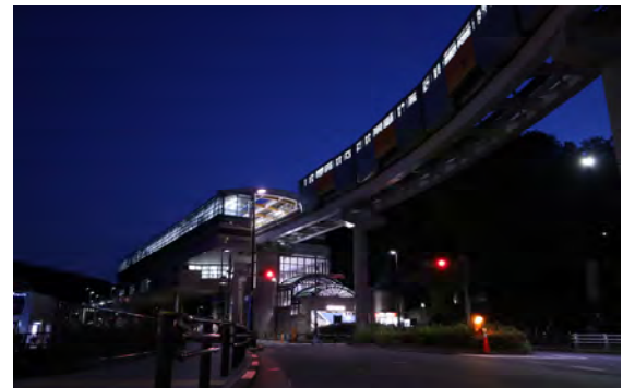
宮崎 敦 様 「静寂に包まれる多摩動物公園駅」