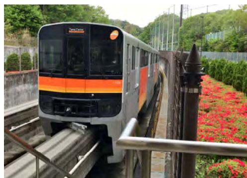
早乙女 瑛一朗 様 「モノレールと赤い花」