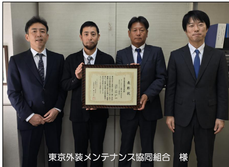
東京外装メンテナンス協同組合 様