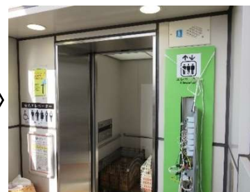
ステップ3 仕上げ工事