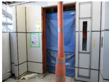
ステップ1 解体工事

https://www.meltec.co.jp/products/ev/elefine/index.html