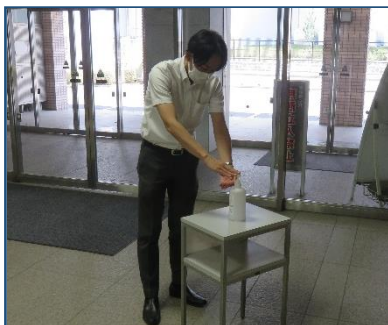
入館時の手指消毒