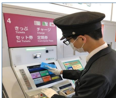
券売機の消毒状況

https://www.tama-monorail.co.jp/konzatsu_graph.pdf