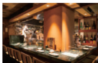
おひとりさまや少人数のグループなど、しみじみと食事の時間を過ごしたい方に。