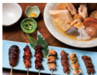
最近では久しぶりの再会を楽しむ友人や同僚の集まりにも利用されるそう。