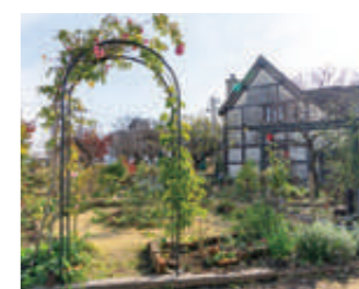
食後は季節の草花でいっぱいの庭園を散策してのんびり。