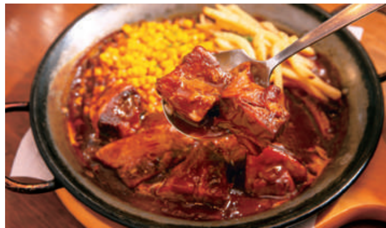
じっくり煮込んだ厚切りビーフシチュー1,680円(ランチは土日祝日のみ)