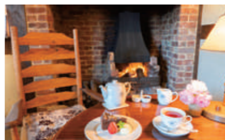
クラシックスコーン(お好みのジャムとクロテッドクリーム添え)とティーのセット825円