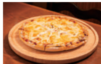
名物のオリジナルMIXピザMサイズ1,750円。ソースは4-5時間煮込んでいます。