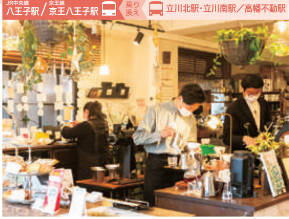
店頭ではコーヒー豆の説明や淹れ方のアドバイスも受けられます。