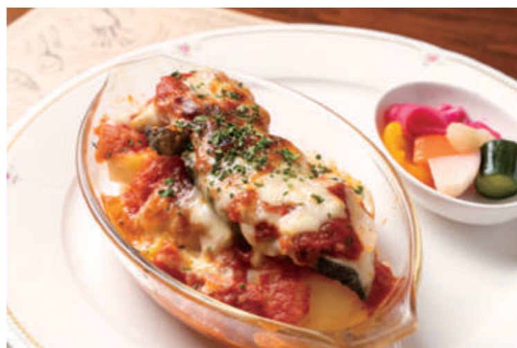
タラとポテトのグラタントマトソースのランチ 自家製パンとドリンク付き1,210円