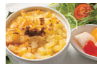
コテージパイ(ひき肉とマッシュポテトの重ね焼き)のランチ 自家製パンとドリンク付き1,210円