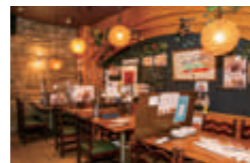
歴史とぬくもりを感じる店内。世代を超えて愛され、親子三代にわたって訪れるファンも多いとか。