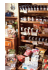
店内ではお店セレクトの輸入食材や雑貨なども販売。