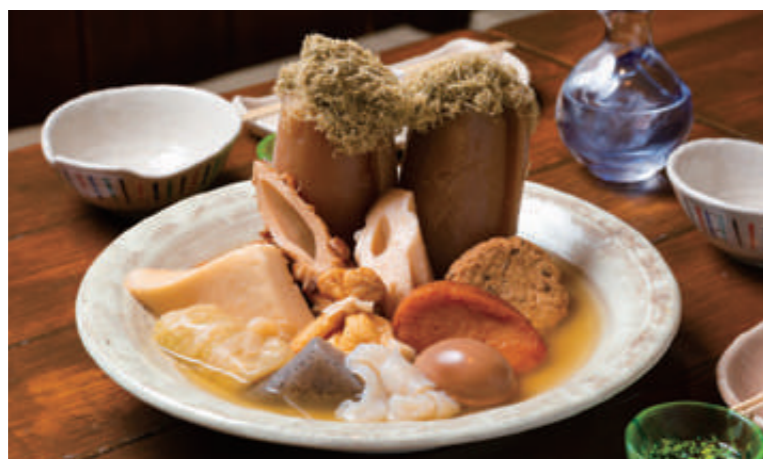
ぜひ立つ大根がひときわ目を引くおでん12種2,574円は、2人でお腹いっぱいボリューム。