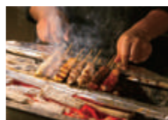
炭火でじっくり焼く串焼きは鶏レバー串など218円より。