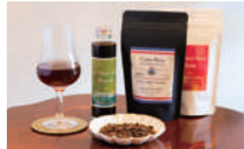
ゲシャ品種コーヒー(グラス提供)、エスプレッソシロップ、コストリカ産オルティス2000 ゲシャ種(手前の豆も)、高尾山ブレンド。

八王子のコーヒー好きで知らない人はいない、といわれるスペシャルティコーヒーの専門店。「最高品質の豆を提供する」が信条で、取り扱うのは世界各地の名農園のものばかり。フルーティな風味の浅煎りから、しっかりとしたコクのある深煎りまでお好みどおりに愉ませてくれます。コーヒー愛好家の間で話題の、希少な「ゲシャ」品種も販売中です。