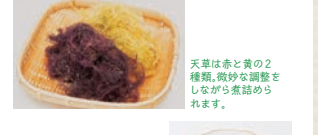
天草は赤と黄の2種類。微妙な調整をしながら煮詰められます。

ところ天やあんみつの寒天は、国産の天草(てんくさ)100%使用なので天草の色が残り、職の香りがしっかり感じられる贅沢な味わい。添付される風味豊かなつゆと薬味でさっぱりと頂けます。あんみつに付く粒あんにも豆本来の甘さが残り、濃厚な黒蜜の芳醇な香りもおいしさを際立たせます。大正15年に創業し伝統的な製法で豆腐、こんにやくなどを製造してきた老舗ならではの逸品です。