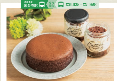
日経新聞(NIKKEIプラス1)なんでもランキング一躍に食べた「ガトーショコラ」にて第1位を獲得したシルキーショコラ。しっとりとした食感で人気を集めています。