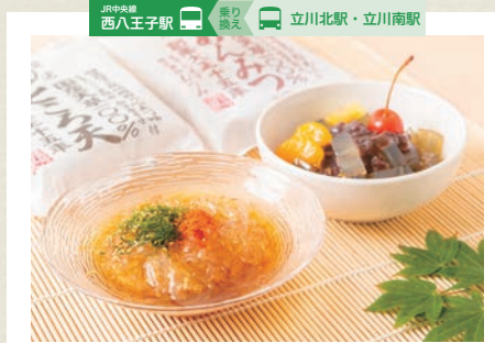
ところ天には、柚子饅頭、糸青のりと金胡麻、柚子唐辛子、あんみつには北海道産大豆の粒、あん、沖縄産黒糖100%の黒糖みつ付き(フルーツは含まれません)。