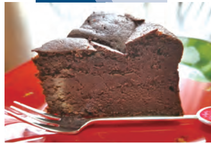
上質なクールチョコレートと北海道産の生クリーム、沖縄産のさび糖など厳選された素材で一つひとつ丁寧に作っています