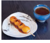
お団子ひと串から気軽に食べられるのが街の和菓子屋さんの魅力。「地元の和菓子店が数えるほどになってしまった」という今、本当に貴重です