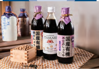
日本一しょうゆには様々な種類の醤油があるので、味や風味に合わせて使い分ければ、料理の幅も広がりの楽しさも増えます

京浜東北線 東横線 京王線 町田駅 乗り換え 京王線 多摩センター駅 乗り換え 小田急線 町田駅