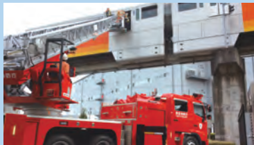
はしご車による救出

また、今回は、立川消防署との合同訓練として、はしご車を使用した救出訓練も行いました。当社公式Twitterにて、今回実施した訓練の動画を掲載しています。左側の二次元コードからアクセスをご覧ください。