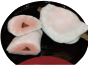
花びら餅は12/30ごろより販売

和菓子には平安の黄砂、砂糖が長い時代から脈々と受け継がれてきたレシピがあります。それをついでにききたいですね。最近では和菓子離れを耳にしますが、美味しいものを作れば反応分かれます。お客さんが喜んでくれる和菓子を作りたいですね。