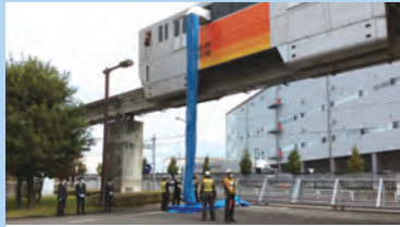
脱出シューターを使用した救出

多摩モノレールでは、災害やトラブル等により、列車が駅間に停車した場合を想定し、お客様を列車内から救出する訓練を定期的に行っています。今回の訓練では、列車内からの様々な救出方法について確認しました。