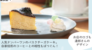
人気ナンバーワンのバスクチーズケーキ。自家焙煎のコーヒーとの相性はばつぐん！