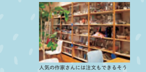
人気の作家さんには注文もできるそう