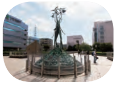
街のシンボル「カマクリ像」

新百合ヶ丘、通称“しんゆり”。モノレール沿線のみなさんには、あまり馴染みがないかもしれませんが、多摩市のおとなり、川崎市麻生区にあります。大規模な商業施設が駅周辺に立ち並び、「芸術のまち」としての顔もつ華やかな街。そんなしんゆりで、自然体で営まれている居心地のいいお店や施設に出会えました。