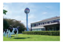
工場は銀色の給水塔が目印。「製造所：東京多摩工場」に記載された商品はこちらから出荷されています