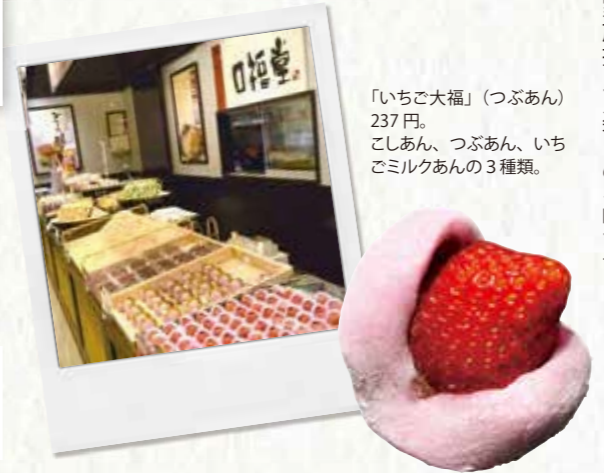
「いちご大福」(つぶあん) 237円。 こしあん、つぶあん、いちごミルクあんの3種類。

「桜餅」など季節の品まで、一つひとつ丁寧に作られたできたての味を提供しています。若い人たちの支持も得ていて、高校生が学校帰りに「お団子」を買っていくのだそうです。「いちご大福」だけでも3種類、どれも大粒のいちごがうれしい、家族揃って楽しめる味です。