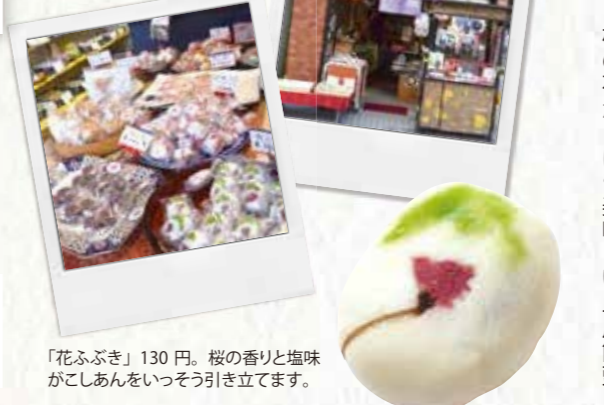
「花ふぶき」130円。桜の香りと塩味がこしあんをいっそう引き立てます。

高幡不動尊参道に長年店を構える「季よせ」には素朴な暖かい雰囲気があります。なつかしい「あんこ玉」、根強い人気の「豆大福」など、和菓子の王道を行く品が並びます。そして昨年からは登場したしょうゆ大福「多摩の都」には早くもファンがいるのだそう。「花ふぶき」は山に見たてた緑と桜の花が目にも美味しい上用饅頭です。