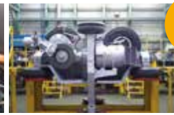
列車から取り外した台車