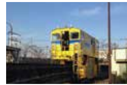
出番を待つ工作車

24時間365日、レールや信号などの保守点検をする所員がいます。終電後にも、工作車という黄色い列車で安全を点検しています。