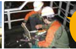
終電後の保守点検

レール、支柱、分岐器、駅舎など、点検するものは多岐にわたるほか、施設・設備の修繕、更新工事も行います。