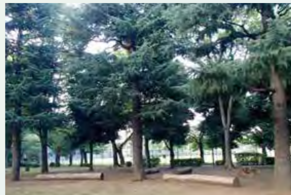
北野公園バーベキューエリア

浅川のほとり、半分は市民球場である北野公園の中にあるバーベキューエリア。基本的に予約不要で利用できますが、管理事務所への利用申請を。器材・食材付きで気軽に楽しめる手ぶらバーベキュープランもおすすです。たくさんの木々に囲まれながら木陰で涼しげにバーベキューが行えます。