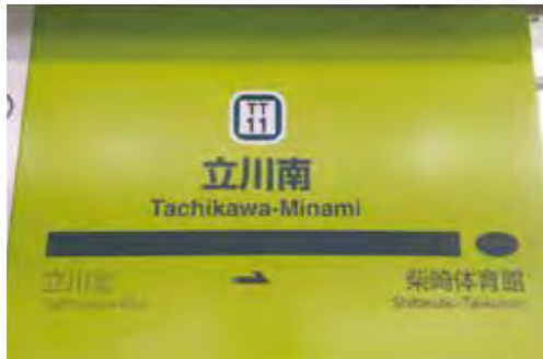
ホームインフォメーション（駅名標）