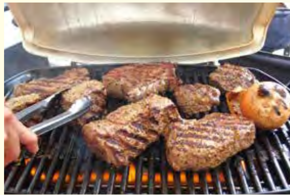
京王フローラルガーデン アンジェ BBQ VILLAGE

従来のバーベキューのイメージを覆す、京王フローラルガーデン アンジェの庭園の中に設えられた施設。園内は様々な草花や緑が生い茂り、四季折々の花たちを愛でながらゆったりと静かに楽しめます。オススメのメニューは「塊肉」ガーデンバーベキュープラン。塊のまま焼くお肉やお野菜はジューシーで、見た目にもテンションが上がります。