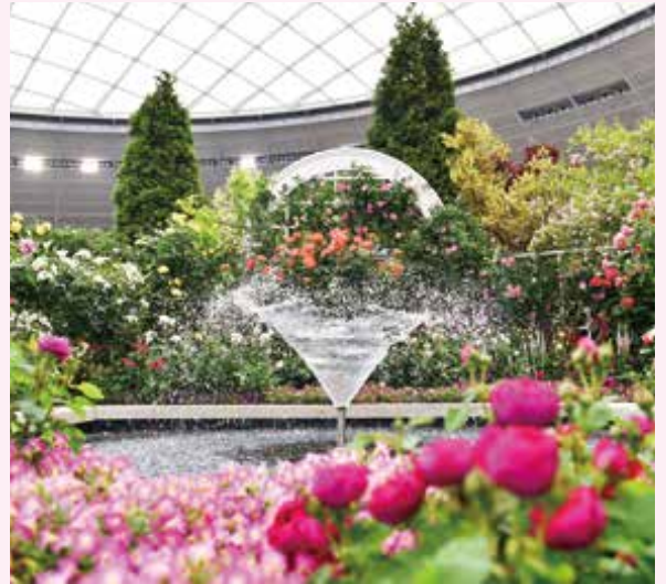
前回(第19回 国際バラとガーデニングショウ)会場より