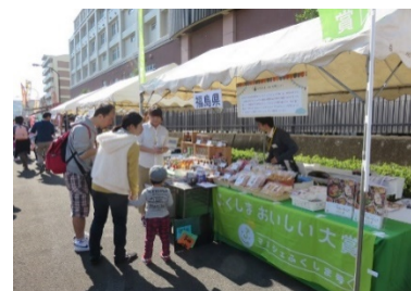
様々な物産展、PRコーナーも開催