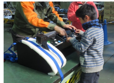
マスコンハンドル操作体験