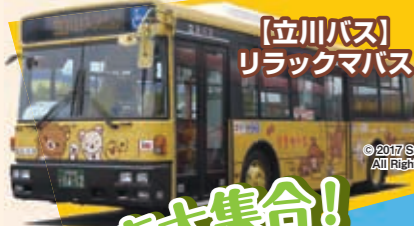
【立川バス】 リラックマバス

© 2017 San-X Co., Ltd. All Rights Reserved.