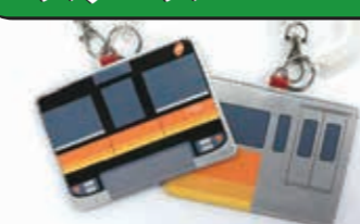
パスケース(前面)(側面)