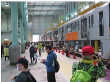
車両搭載機器展示