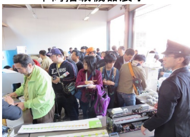
タマモノグッズの販売