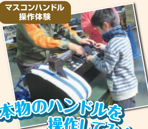
マスコンハンドル 操作体験