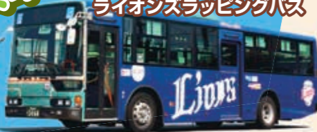
【西武バス】 ライオンズラッピングバス