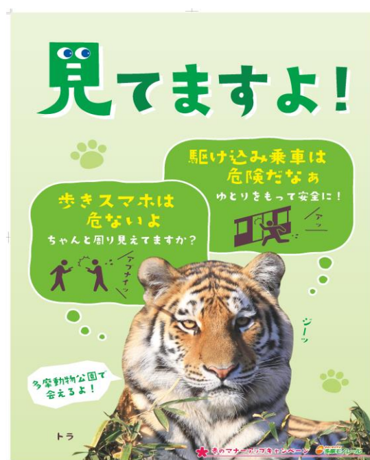
車内吊りポスター2種類 (左) と駅貼りポスター (右)