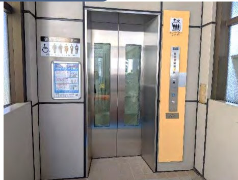
改札階エレベーター