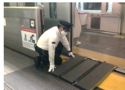
持ち運び式スロープ