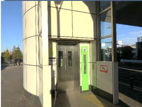
地上のエレベーター