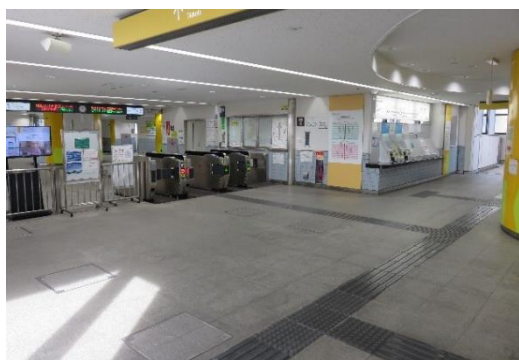
万願寺駅内コンコース

特別緊急避難ステーションの利用エリアは、駅務室や機器室等を除くコンコースになり、開設時には駅へ避難できるようシャッターを開放します。特別緊急避難ステーションとして使用できるのは原則として水害発生から24時間で、使用時間経過後は状況に応じて自宅に戻るか（正規の）避難場所に移動します。