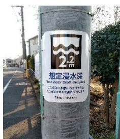
浸水想定区域の 浸水深を示す看板